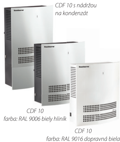
CDF 10 s nádržou na kondenzát

Okrem zabudovaného hygrostatu nastaveného na 60% relatívnej vlhkosti a LED signalizácie zobrazujúcej všetky prevádzkové stavy, ponúkajú tieto odvlhčovače pripojenie na bezdrôtový diaľkový ovládač DRC1, ktorý umožňuje diaľkovo nastaviť teplotu, vlhkosť, či zobrazí poruchy alebo servisné informácie.