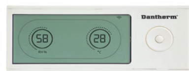
Bezdrôtový diaľkový ovládač DRC1